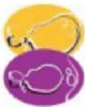
График внутриутробного роста плода